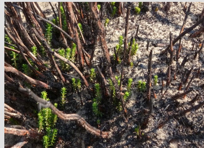
Camarina rebotando tras el incendio de Mazagón-Doñana de 2017.

21-23 de Marzo 2018. Auditorio de Caja Rural del Sur, Plaza Magdalena, Sevilla