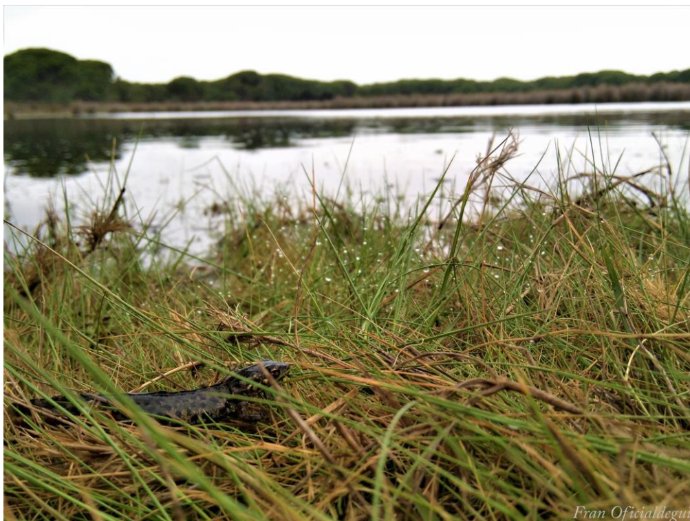
Ejemplar de tritón pigmeo ( Triturus pygmaeus ) cerca de una charca del Parque Nacional de Doñana.