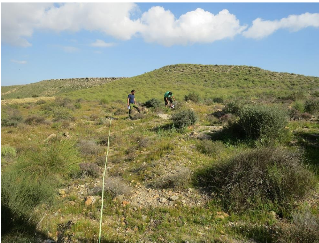
Parcela a un kilómetro de distancia de los invernaderos.