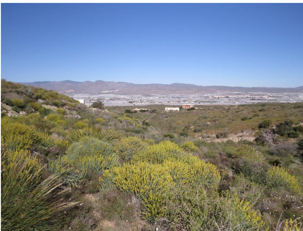
Parcela a 500 metros de los invernaderos.