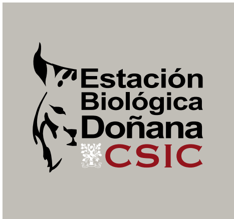
Logotipo positivo color sobre fondo de color gris

Ejemplos de comportamiento del logo a color sobre diferentes fondos