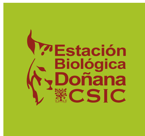
Logotipo positivo color sobre fondo de color claro