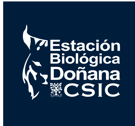
Logotipo color sobre fondo de color oscuro