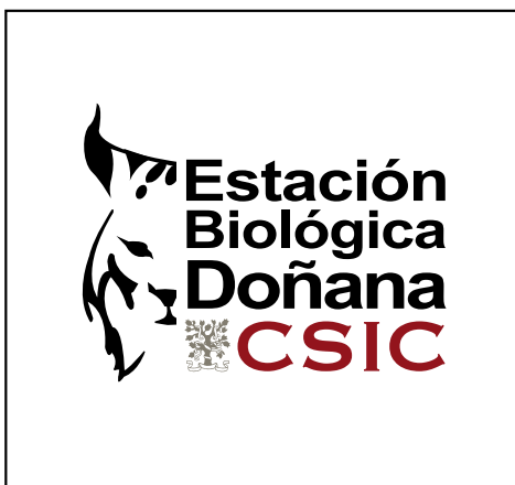
Logotipo positivo color sobre fondo blanco