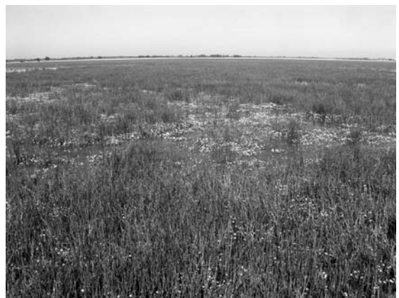
Figura 1. Ejemplo de zona inundada con una alta cobertura de vegetación flotante y emergente.

Una vez seleccionado el mejor predictor para inundación, mediante un árbol de clasificación con las categorías de inundación como variable respuesta, determinamos el mejor punto de corte para definir la categoría de inundado. Usamos para el árbol un valor mínimo de corte de 5, un tamaño mínimo de 10 y una devianza mínima de 0.2.